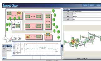
※ 画像はイメージです